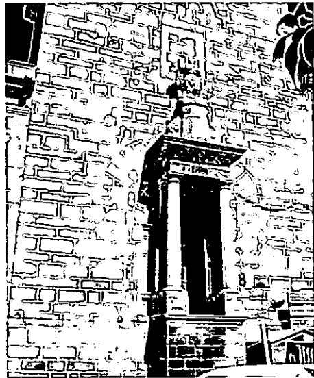
Monumento a San Rafael, ubicado en la iglesia parroquial de San Bartolomé

Mención aparte merece su intervención en el llamado asunto del poyo que su compañero el ilustrado cura de Montoro López de Cárdenas mantuvo con el Ayuntamiento 22 .