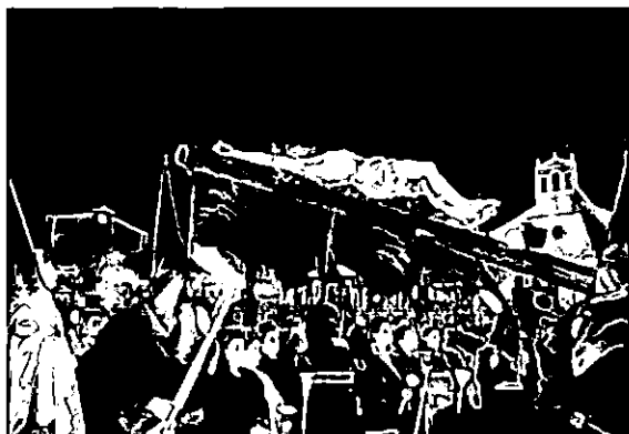
Cristo Crucificado y del Amor en la "Procesión del Silencio" en la madrugada del Jueves Santo