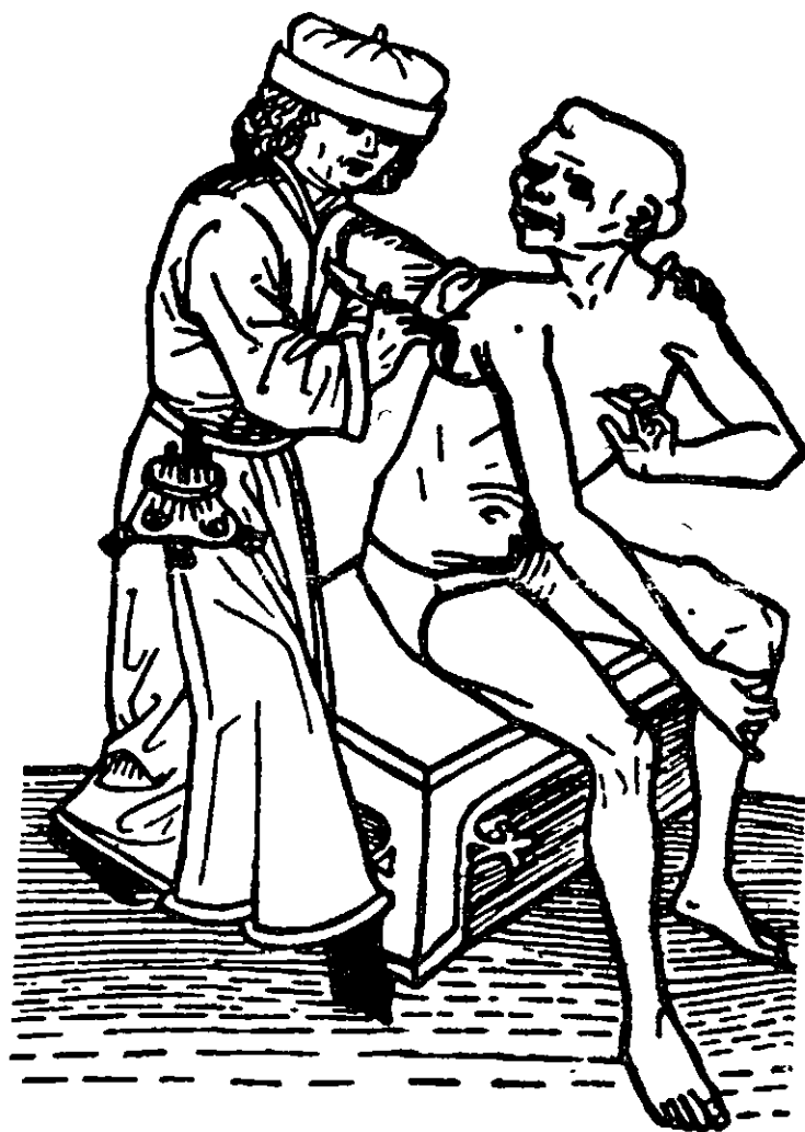
Enfermo de peste bubónica atendido por un cirujano (xilografía del Spruch von der Pestilenz, por Hans Folz, año 1482)