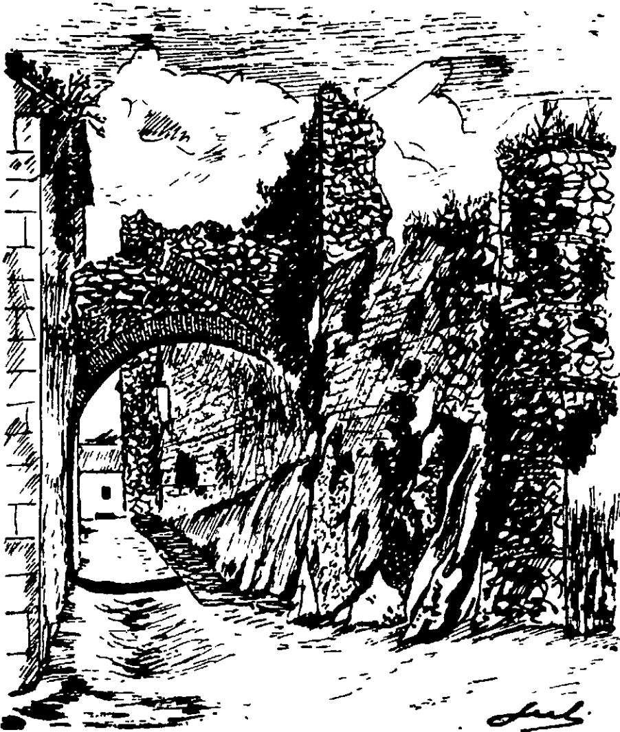
Fig. 1. Ruinas de la "iglesia vieja" y castillo de Doña Mencía. En el dibujo de Julián Urbano se aprecia perfectamente la reducción del arco por motivo de la ampliación de la iglesia.