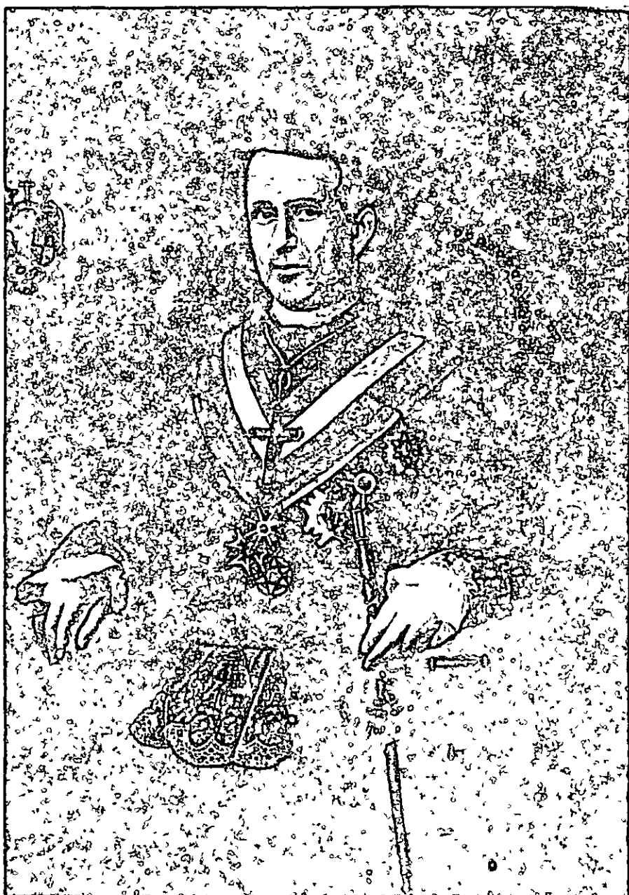
Fig. 2 Cuadro al óleo que se conserva en la Sala Capitular del Ayuntamiento de Doña Mencía, de autor desconocido. Representa al Obispo Cuvero, D. Pedro María Cuvero y López de Padilla.