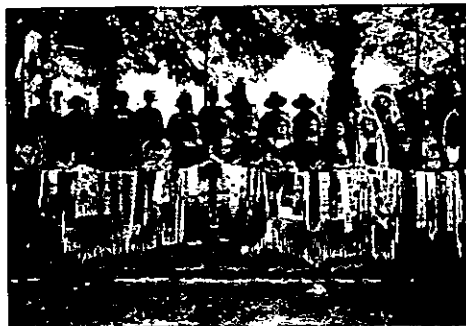
Belles bailando en la noche en grande la carrera de cintas

Bajo sendas fotografías de un grupo juvenil femenino engalanado, en el acto de presidir la carrera de cintas, unas líricas estrofas de una anónima «Canción de mis amores», cual un repique de campanas a lírico vuelo, entonan gráficamente el más satisfactorio goce: