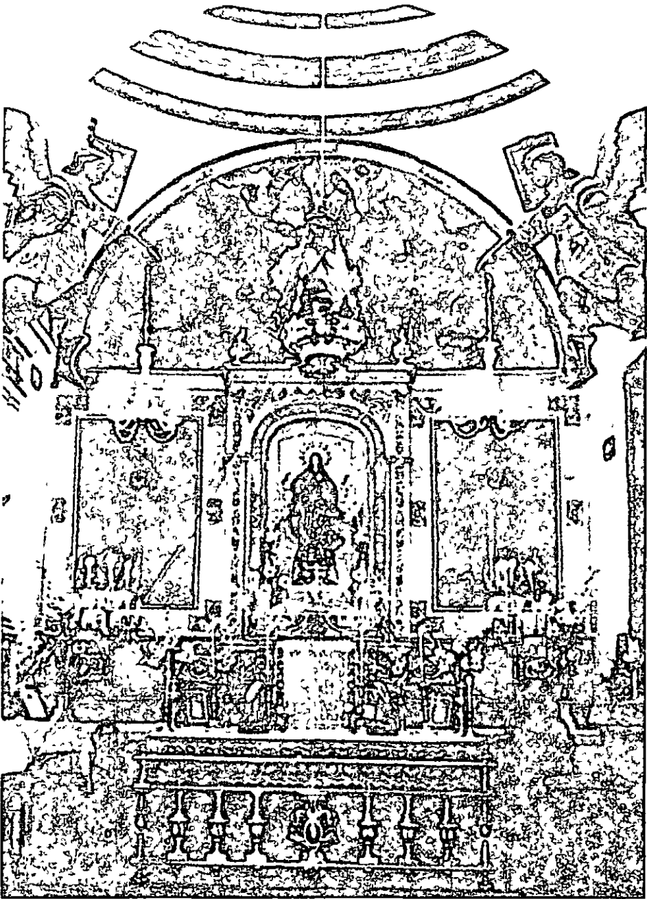
Capilla del Sagrario