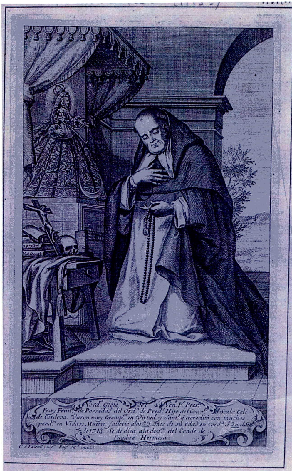
Juan Bernabé Palomino. Retrato del beato Francisco de Posadas.¿1713? Biblioteca Nacional de España.