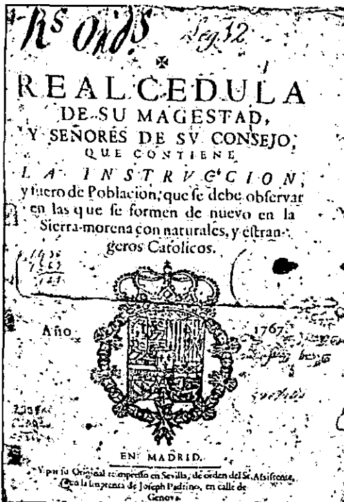
Portada de la Real Cédula. Archivos Municipales de Fuente Palmera

“SABED, que habiéndome propuesto Don Juan Gaspar de Thurriegel, de nación bávaro, de Religión Católica, la introducción de seis mil colonos católicos alemanes y flamencos en mis dominios, tuve a bien admitir esta propuesta baxo de diferentes declaraciones, que reducidas a contrata se expresan por menor en mi Real Cédula”. 1