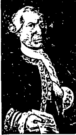
Retrato de Juan Gaspar de Thürriegel

Condición que no siempre se cumplió porque ni Thürriegel ni sus enganchadores se preocuparon de hacerlo, por sus prisas en realizar la totalidad de la contrata.