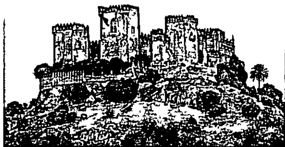
Vista del castillo de Almodovar del Rio

Y es que la investigacion requiere no solamente repasar los abundantes archivos de las grandes bibliotecas, sino tambien los escondidos en los diversos pueblos que por falta de tiempo o por no haber investigado en ellos no se encontraron anteriormente. Este es el caso de la venta de la villa y castillo de Almodovar del Rio