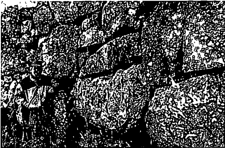
Detalle de la muralla ciclopea