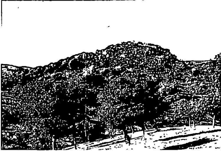
Vista del castillo de Sibulco