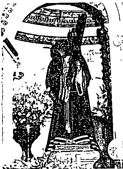
Milagrosa imagen de Ntro Padre Jesus del Calvario

Esta devocion bendecida por la sagrada imagen de Jesus Nazareno, le ha hecho acreedora de distinguidas mercedes y gracias pontificales, diocesanas y reales Bula, concediendo jubileo e indulgencias, de Clemente IX a la Cofradia, 13 de junio de 1668, otorgada en la capilla de San Pedro de Roma "Considerando la fragilidad de nuestra inmortalidad, la condicion del género humano, y la severidad del Juicio Final, por buenas obras y piadosos ruegos, para que ellos sean borrados de sus pecados, y ellos mimos merezcan conseguir mas facilmente los gozos de la Eterna Felicidad"