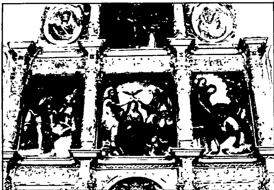
Retablo de la capilla de San Juan Bautista.

heredero de la casa marquesal de Priego. Probablemente su ausencia de la villa se debiera a algún incidente de denuncia ante el Santo Oficio (28).