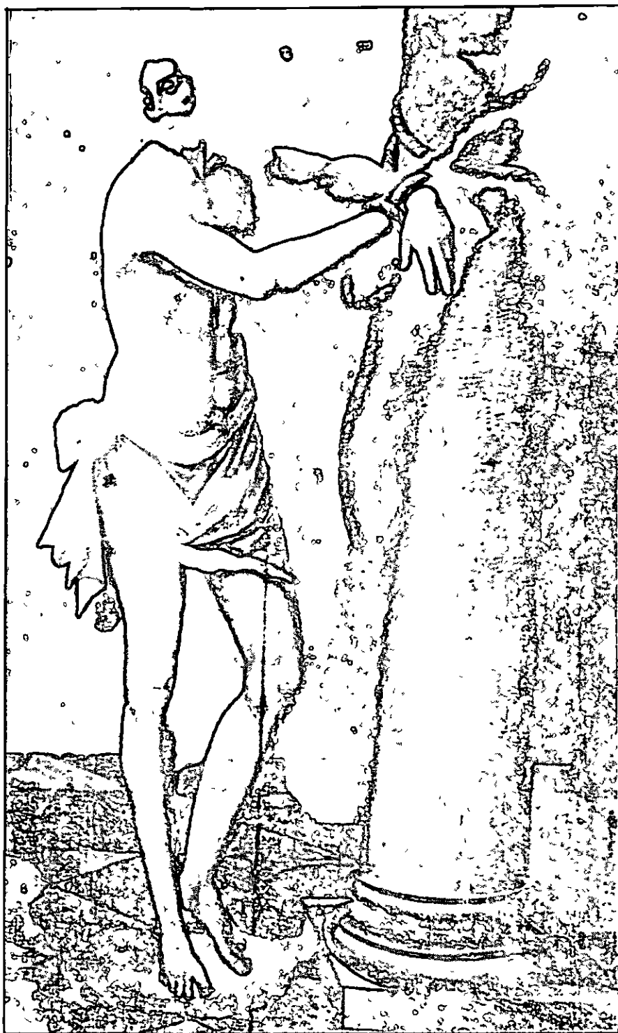
Ecce Homo, atribuido a Francisco de Castillejo (Actualmente en casa de San Juan de Avila, Montilla)