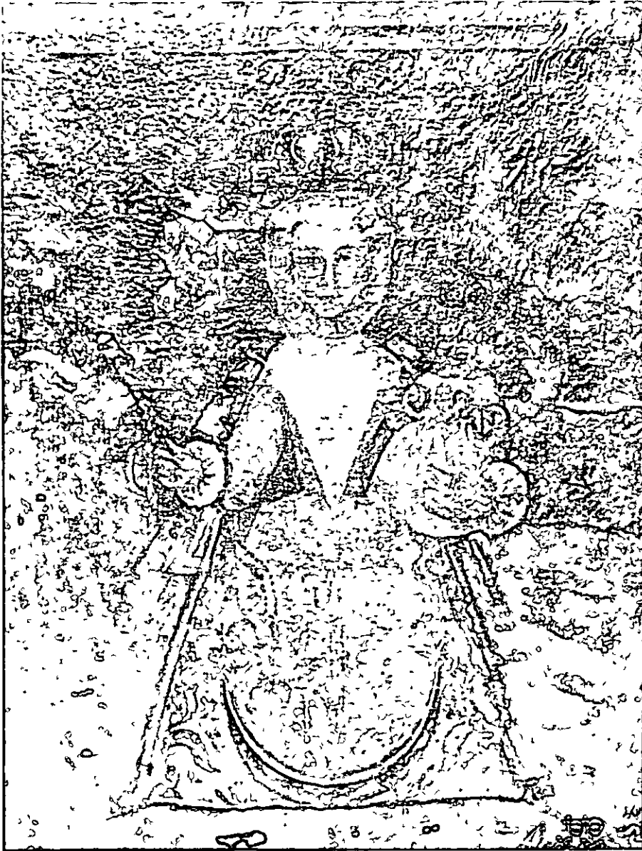
Fig. 2. Nuestra Señora de la Salud, según el cuadro de las hermanas Uceda. Aunque del tipo de los de "seis reales", es, sin duda, este cuadro muy anterior a ellos, pues debe ser de principios del XVIII.

La Virgen usa valona, peto y lechuguillas en las bocamangas, muy estrecha la cintura y falda amplísima. El Niño persevera con las lechuguillas y el guardainfante.