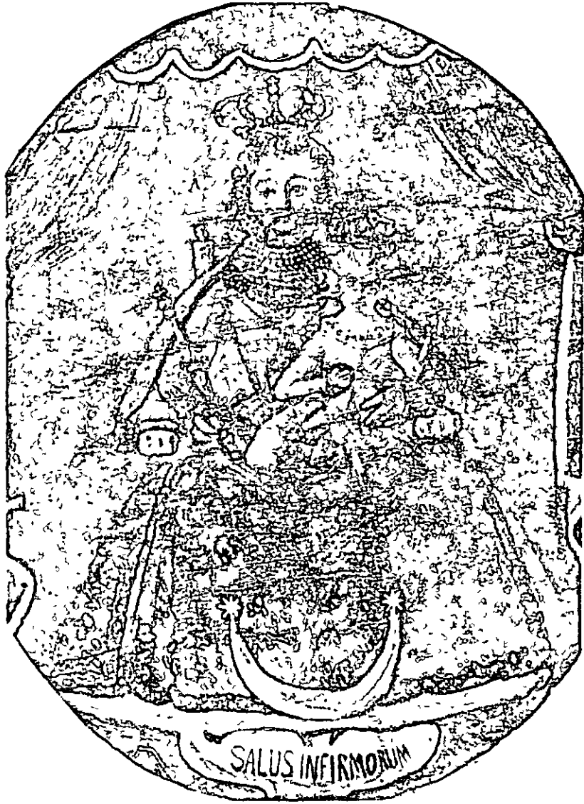
Fig. 3. Nuestra Señora de la Salud, según el medallón del antiguo estandarte. La Virgen continúa poco más o menos como en los anteriores, excepto en que cambia la valona por cariñana, pierde el ramo de la mano derecha y no porta el medallón. Las lechuguillas han sido sustituidas por un fruncido en las bocamangas.

El Niño sigue con su guardainfante y usa una especie de lechuguilla vergonzante, pues en lugar de rodear el cuello, va de hombro a hombro.