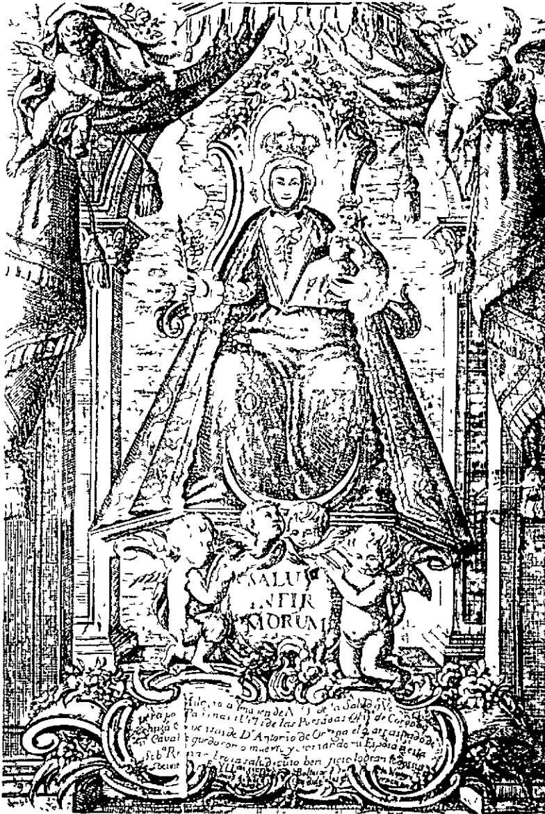
Fig 1. Nuestra Señora de la Salud según un grabado del siglo XVIII. Aunque carente de fecha, el obispo Don Baltasar Yusta y Navarro que concede las indulgencias, gobernó la diócesis en la década de los setenta del XVIII, pero la plancha parece ser muy anterior a juzgar por el ropaje de la Virgen. Obsérvese la exageración de la falda y en el Niño el armazón del guardainfante