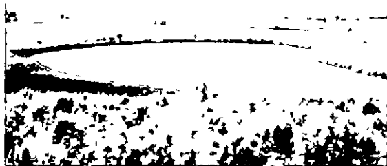
Antiguo abrevadero de la Laguna del Rincon, hoy Reserva Natural

Las citadas lagunas y abrevaderos, así como el resto de las tierras pertenecientes al caudal de Propios, habían sido vendidas a censo por el municipio para sufragar diversas obras públicas, como la construcción de dos fuentes en el caso de las enajenaciones de 1833 o respondiendo a las reales ordenes de 24 de agosto de 1834 y aclaratoria del 3 de marzo de 1835 en el caso de las enajenaciones de 1836 6