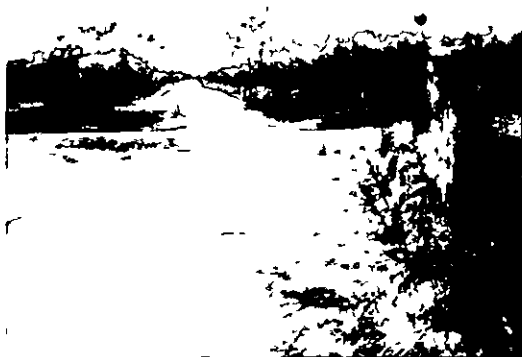
Tramo de la vereda de Zoñar denominado "vereda de los Pinos"

las veredas una anchura de 40 varas castellanas (equivalente a 33,4 m), distancia entre un olivar y otro ambos viejos, en el sitio de los Frailes de la vereda de Zoñar, abierta desde tiempo inmemorial.